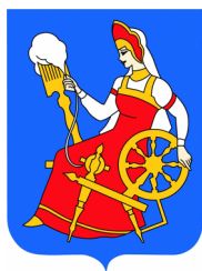
Рис. 2. Герб города Иваново

На все иллюстрации в тексте должны быть даны ссылки.