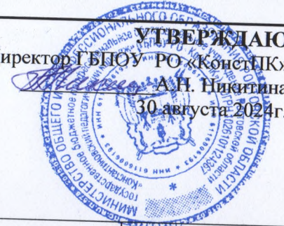
ГРАФИК УЧЕБНОГО ПРОЦЕССА студентов I курса отделения заочного обучения специальности 44.02.05 Коррекционная педагогика в начальном образовании на 2024-2025 учебный год