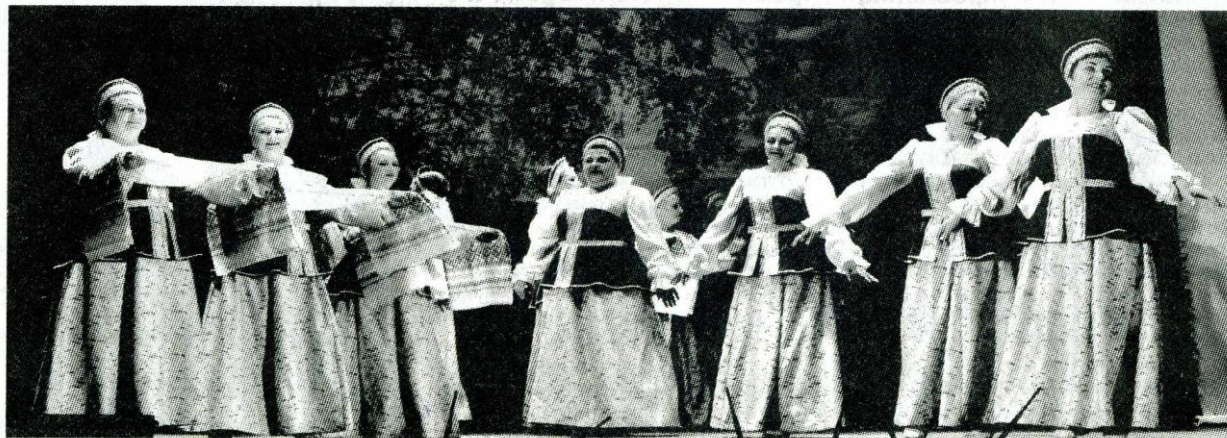
Танец "Русские просторы" - на сцене народный хореографический коллектив "Девчата".