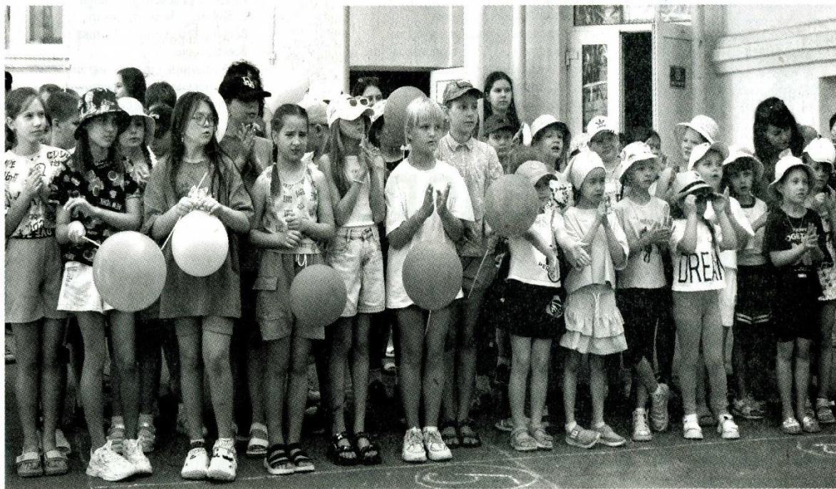
На открытии лагерной смены в КСОШ № 1.

Организаторами игры были педагоги Центра внешкольной работы, которые отправили детей путешествовать по пяти станциям: «Безопасное лето», «Экологическая», «Рисунок на асфальте», «Эрудит», «Спортивная»,