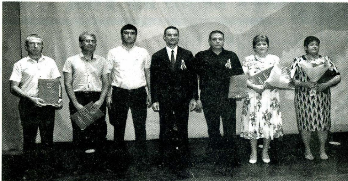
Награждение Благодарственными письмами губернатора области.