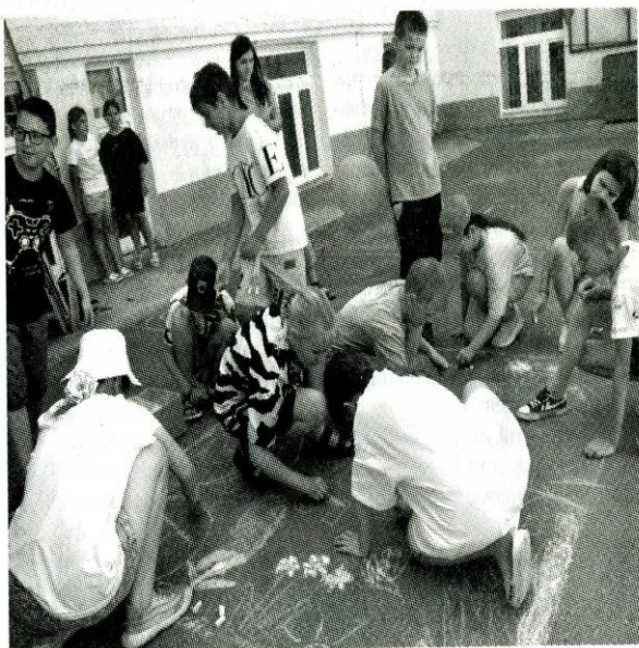
Рисуем лето на асфальте.