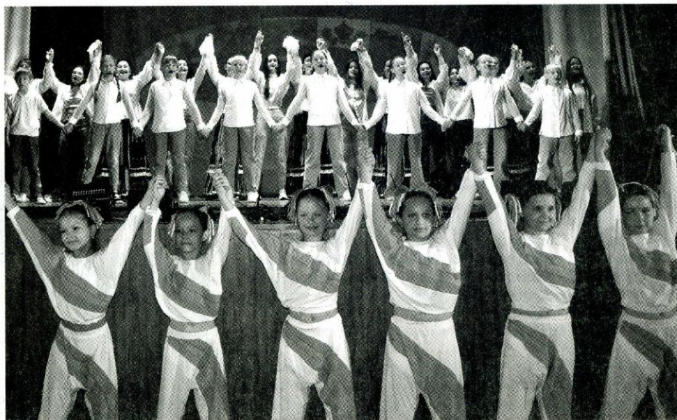
Хоровод дружбы: "Дружная Россия - дружная семья".