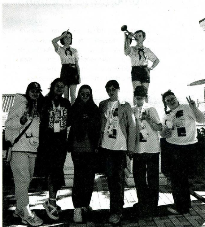
Участницы первого заезда.