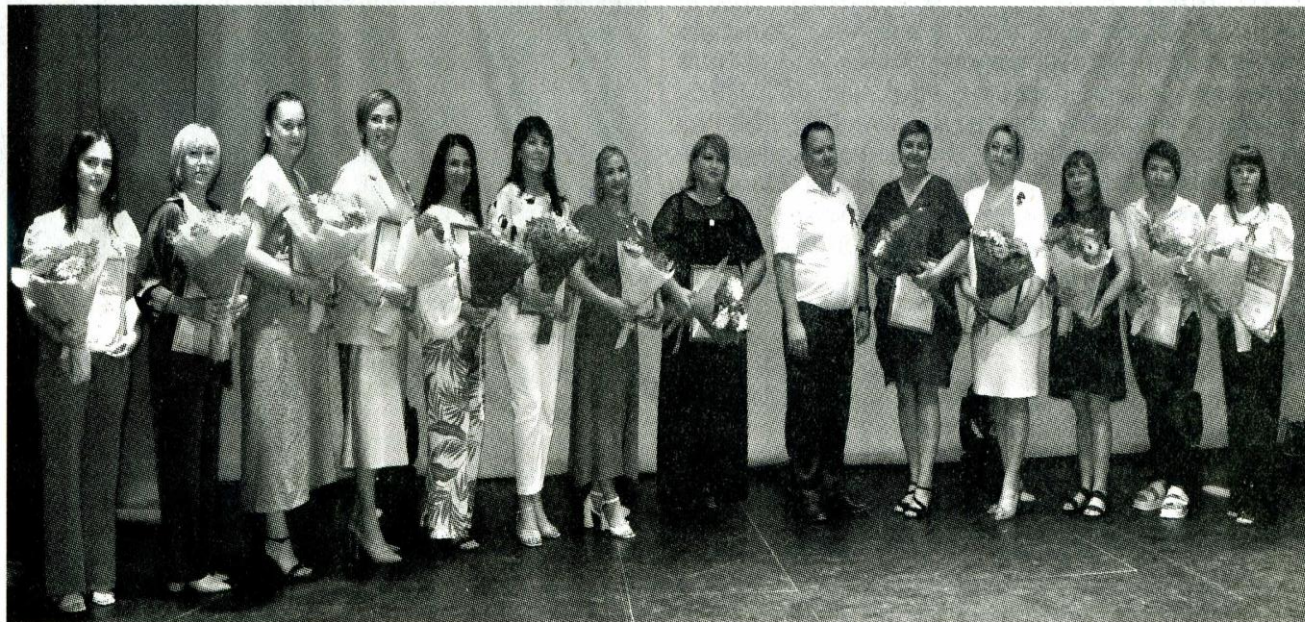
Награжденные Приветственным адресом губернатора Ростовской области.