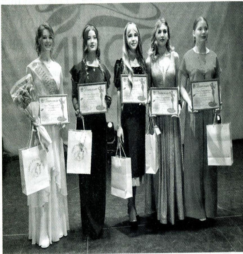
Участницы районного фестиваля-конкурса.

Завершающий конкурс «Дефиле с зонтиками», где девушки предстали в шикарных платьях, с потрясающими