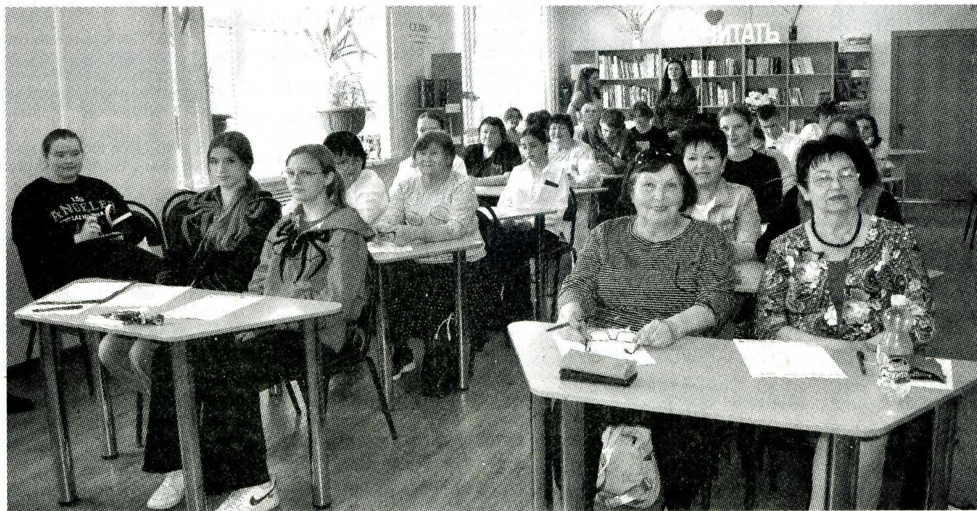
Районная библиотека впервые стала одной из площадок Тотального диктанта.