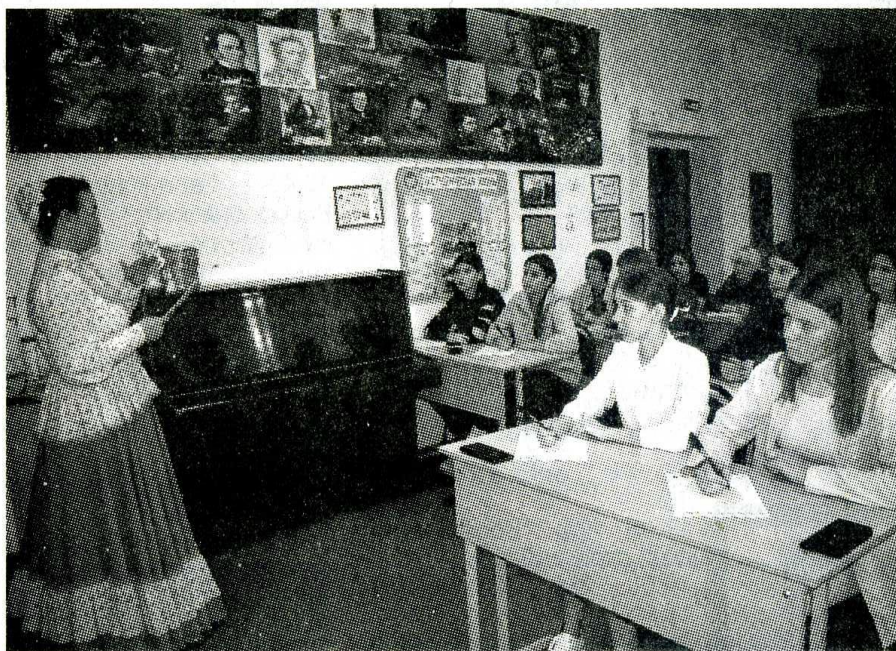
Площадка Тотального диктанта в педколледже получилась молодежной.

20 апреля константиновцы вместе с сотнями тысяч людей по всей стране и за рубежом написали Тотальный диктант.