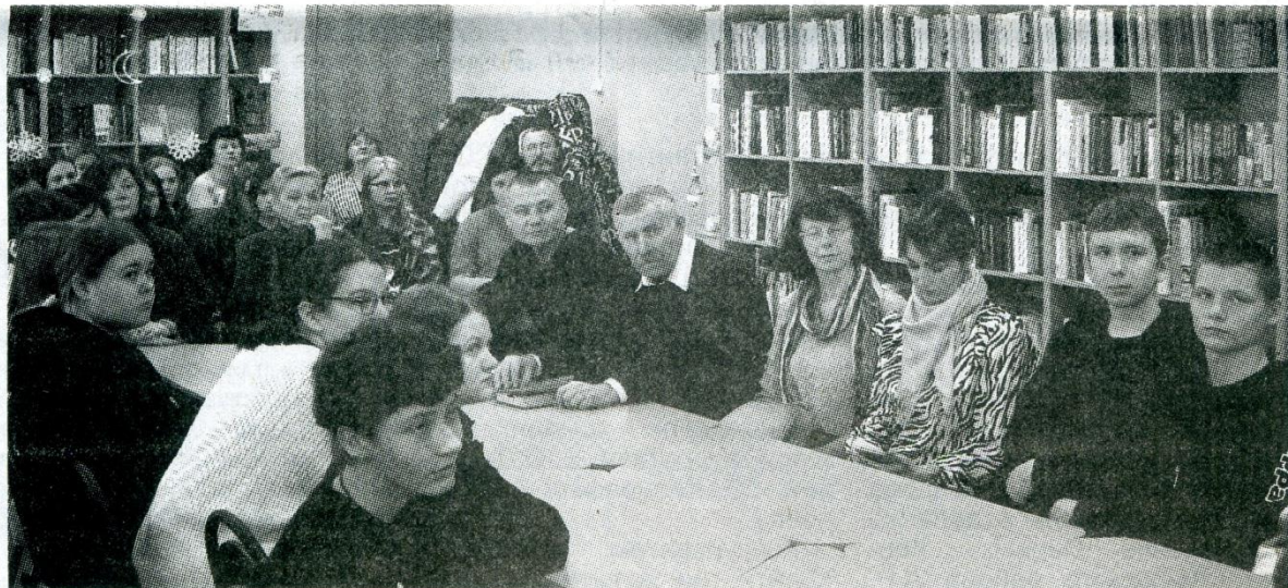
Участники "круглого стола".