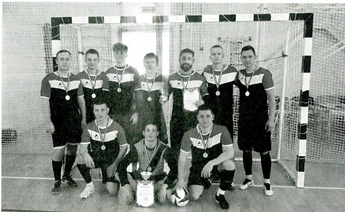
Команда КТАУ - победитель предновогоднего турнира.

В физкультурно-оздоровительном комплексе города Константиновска прошел традиционный предновогодний турнир по мини-футболу среди взрослых команд.