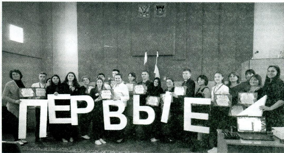
Участники районного конкурса "Лидер года-2023".

В декабре в большом зале администрации Константиновского района прошел районный конкурс лидеров детских и молодежных общественных объединений «Лидер года-2023».