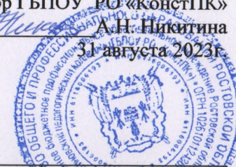
ГРАФИК УЧЕБНОГО ПРОЦЕССА студентов III курса отделения заочного обучения специальности 49.02.01 Физическая культура на 2023-2024 учебный год