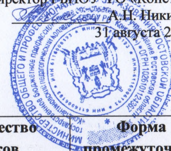
ГРАФИК УЧЕБНОГО ПРОЦЕССА студентов II курса отделения заочного обучения специальности 44.02.05 Коррекционная педагогика в начальном образовании на 2023-2024 учебный год