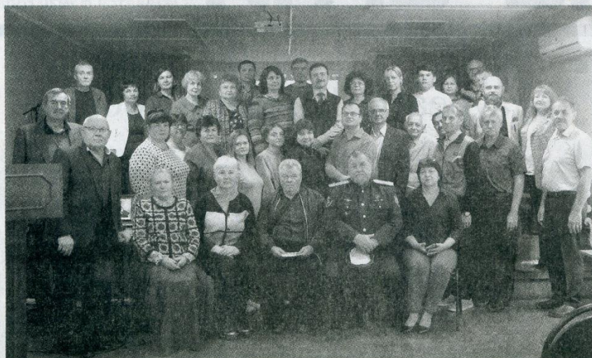
Участники 16-х краеведческих чтений.