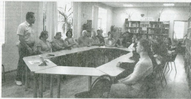
Участники "круглого стола" в библиотеке.

Алексей Лосев был оставлен на кафедре классической филологии для приготовления к профессорскому званию. Он учительствовал в московских гимназиях и школах, одновременно готовясь к магистерским экзаменам, которые успешно выдержал, преподавал во 2-м Московском государственном университете и Государственной академии художественных наук. Будучи в 1922 году научным сотрудником Института музыкальной науки, он внес вклад в разви-